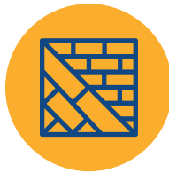
Uso en piso y muro